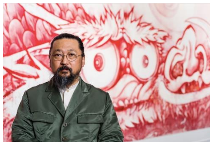
撮影：Museum of Fine Arts, Boston ©2017 Takashi Murakami/Kaikai Kiki Co., Ltd. All Rights Reserved.

1962年、東京都生まれ。1993年、東京藝術大学大学院美術研究科博士後期課程修了。博士号取得。博士論文は「美術における『意味の無意味の意味』をめぐって」。2000年、伝統的日本美術とアニメ・マンガの平面性を接続し、日本社会の在り様にも言及した現代視覚文化の概念「スーパーフラット」を提唱しました。2001年、自身が代表を務める有限会社カイカイキキを設立。2005年、「リトルボーイ展」(ジャパン・ソサエティ、ニューヨーク)にて、全米批評家連盟ベストキュレーション賞受賞。2015年、文化庁「第66回芸術選奨」文部科学大臣賞受賞。近年は、「Stepping on the Tail of a Rainbow」(ザ・ブロード、LA、2022年)、「MurakamiZombie」(釜山市立美術館、釜山、2023年)、「Understanding the New Cognitive Domain」(ガゴシアン、ル・ブルジェ、2023年)、「Takashi Murakami: Unfamiliar People - Swelling of Monsterized Human Ego」(アジア美術館、サンフランシスコ、2023年)など、世界各地で個展が開催されています。