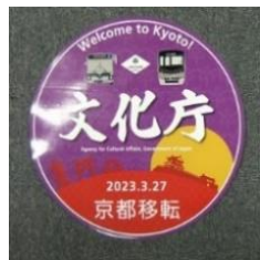
文化庁京都移転記念ヘッドマーク(バス)

今回初出品となる文化庁京都移転記念ヘッドマーク（バス）や目玉商品の3連電気メーター（地下鉄）など100種類を超える市バス・地下鉄の廃品を販売します。廃品の購入については、個数制限を設ける予定です。廃品販売の詳細は後日、交通局ホームページでお知らせします。