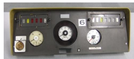
烏丸線10系車両運転台パネル