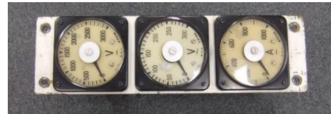
3連電気メーター(地下鉄)