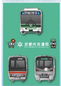
ピンバッジイメージ