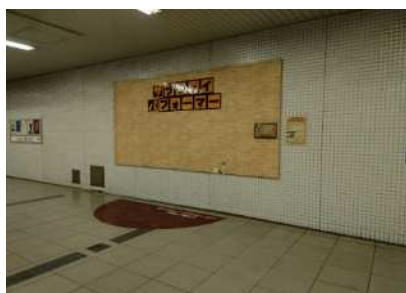
<パフォーマンスエリア>

その後、コロナ禍も落ち着きを見せ、交通局では今後の事業再開に向けた議論をこれまで繰り返し行ってきましたが、この度、「meetus 山科-醍醐」の取組の一環として、再開に向けて、地下鉄醍醐駅でのイベントを開催することとしました。