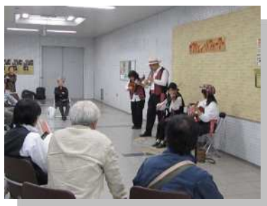
<休止前のパフォーマンスの様子>