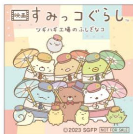
【ましかくステッカー イメージ】