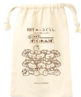
【こっとん巾着 イメージ】