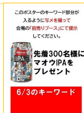
【キーワード イメージ】