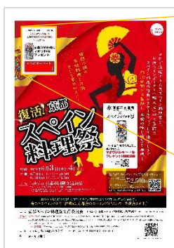
【B1ポスター イメージ】