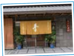
「香色(こういろ)」ののれんが目印

☎075-441-1123 開10時30分～17時 休お盆、年末年始 地下丸太町駅から 徒歩約7分