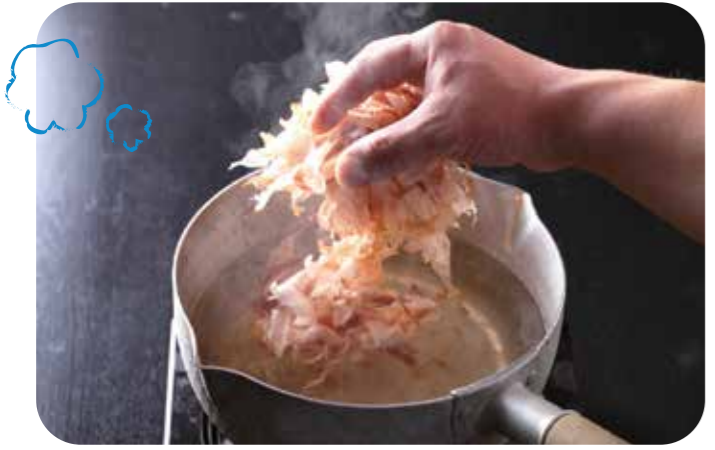
和食の原点であるだしの旨みと香りを体感