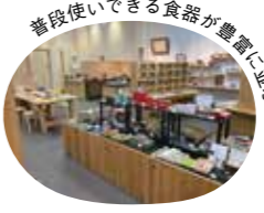
普段使いできる食器が豊富に並ぶ

ホテルエミオン京都 京都駅前から市バス205・86・88 梅小路公園・JR梅小路京都西駅前下車すぐ