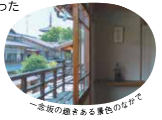
一念坂の趣きある景色のなかで