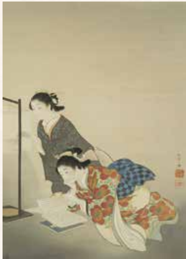
上村松園《長夜》(前期展示)

📍 京都駅から 市バス 28 または 太秦天神川駅から 市バス 11 嵐山天龍寺前(嵐電嵐山駅)下車、徒歩約5分