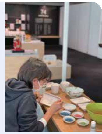
京焼・清水焼の職人実演の様子 ※実施日や内容等の詳細はHP参照

☎075-762-2670 休9時～17時(最終入館16時30分) 休不定休(7・8月は、7月25日・8月23・24・29日) 地下東山駅から徒歩約10分、または京都市役所前から市バス32 岡崎公園ロームシアター京都・みやこめっせ前下車すぐ、または京都駅前(または三條京阪前)から市バス5 岡崎公園美術館・平安神宮前下車、徒歩約5分