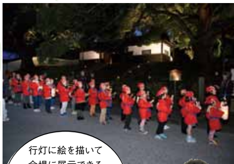
火の用心・お囃子組

行灯に絵を描いて会場に展示できる「お絵かき行灯」は人気なのでお早めに！（無料、各日先着100名）