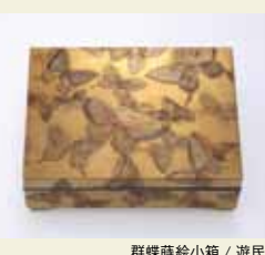
群蝶蒔絵小箱 / 遊民 9.3 x 12.3 x 4.0 cm

繊細できらびやかな装飾が施された、手の平サイズの蒔絵の小箱。鎖国の開けた19世紀には西洋人たちをも魅了し、おびたしい数の作品が海を渡っていったという。欧米より里帰りした作品を含む約60点の華麗な世界が広がる。