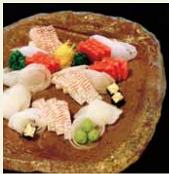
「造り盛込 備前四方(京都吉兆にて)」

丸太町通 075-761-9900 9時30分~17時 (会期中金曜は20時まで 入館は各30分前まで) 1,400円 月曜 (7/20は開館)、7/21