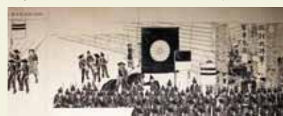
戊辰戦争絵巻 雲山歴史館蔵

吉田松陰ら長州藩士の貴重な資料で展開する通年特別展。薩長同盟や明治維新を俯瞰する第4期では、同盟締結に大きな役割を果たした坂本龍馬、中岡慎太郎や、維新へと導く戊辰戦争の資料などで、激動の時代をひも解く。