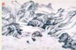
堂本印象 世相三題(部分) 1921年 京都市立芸術大学 芸術資料館(前期展示)

明治13年開校、日本で最も古い芸術系大学である京都市立芸術大学所蔵の名品から、近代日本画の足跡や京都の美術教育を探る。同大学の前身・京都市立絵画専門学校卒業生であり教員でもあった印象ゆかりの作品も特別に展示する。