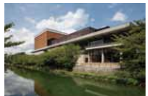
琵琶湖疏水の四季も楽しめる

50年以上、岡崎の地で“文化の 殿堂”として親しまれてきた「京 都会館」が、2016年1月に「ロ ームシアター京都」としてリニ ューアルオープンする。さまざま な舞台芸術公演が行われる3つ のホールのほか、レストランやブ ック&カフェがある憩いのスペ ース「パークプラザ」など、新た に加わる施設にも要注目だ。