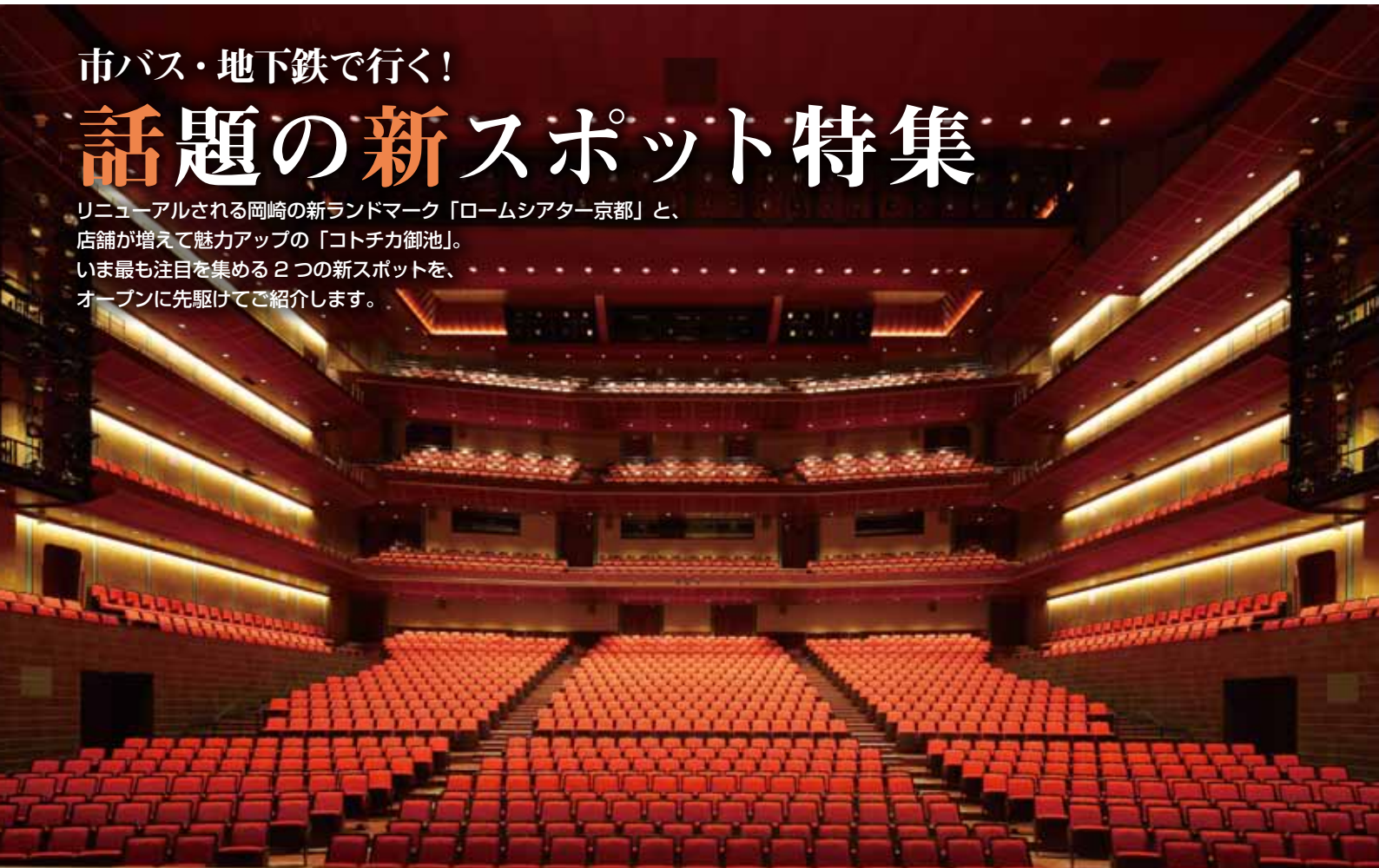
ロームシアター京都 オペラ、バレエなどの総合舞台芸術公演も楽しめる「メインホール」

リニューアルされる岡崎の新ランドマーク「ロームシアター京都」と、 店舗が増えて魅力アップの「コトチカ御池」。 いま最も注目を集める2つの新スポットを、 オープンに先駆けてご紹介します。