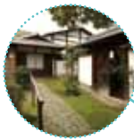
情緒漂う町並みに佇む社家の梅辻家住宅