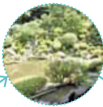
清水寺 成就院で江戸初期を代表する「月の庭」を堪能