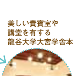
美しい貴賓室や講堂を有する龍谷大学大宮学舎本館