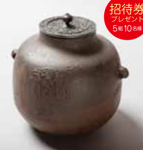
芦屋 福祿寿釜 大西清右衛門美術館所蔵

約400年の伝統と技を守る千家十職の釜師・大西家。ゆかりの茶道具にみる新春ならではの招福の意匠を、茶の湯釜を中心に紹介する。一年の多幸や無事を願う心が映し出された、生き生きとした色彩や造形に目を奪われる。