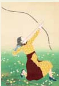
浅井忠(クレイ)の櫻 1901年

公立美術館として戦前からコレクションを形成し、常設展示を行ってきた京都市美術館。開館80周年を記念した今回の展示では、「美術館のコレクション形成」という観点から、美術館の誕生や今日の美術館の在り方を探る。