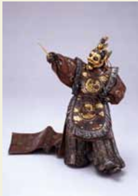
海野勝次(蘭陵王置物) 明治23(1890)年 宮内庁三の丸尚蔵館所蔵