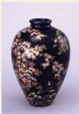
並河靖之(七宝四季花鳥図花瓶) 明治32(1899)年 宮内庁三の丸尚蔵館所蔵

おすすめアクセス ♀京都駅前から市バス5-100♀京都国会美術館前下車すぐ、または地下東山駅下車、徒歩約10分