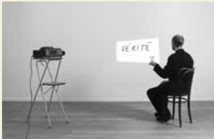
〆アノトフ(絵巻) 2003年

おすすめアクセス 〆京都駅前から市バス5-100〆京都館美術館前下車すぐ、または地下鉄東山駅下車、徒歩約10分