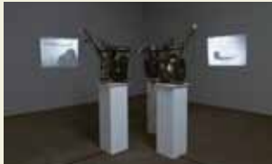
マルセル・ブローターズ (シネマ・モデル) 1970年