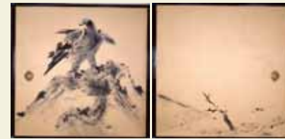
襖絵12面のうち2面、昭和9年

約60年の画業において、一貫して日本の伝統的な表現手段である墨を用い続けた堂本印象。今回は、東寺小子房の襖絵を中心に、具象から抽象にいたる作品を一堂に集め、印象が描いた墨絵の多様な表現を紹介する。彩色画とはひと味違う、妙なる世界を堪能できる。