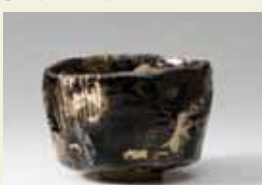
9代樂入 (1756~1834) 作 黒樂茶碗

樂家初代長次郎から15代吉左衛門、次代後継者・樂篤人までを解説する楽歴代図録の決定版「定本 楽歴代」。本に収録された代表作203点を順次紹介する展覧会第2弾を開催。樂焼450年の歴史の中に、革新し続ける各代の作陶の軌跡が浮かびあがる。