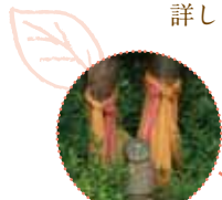
まずは六角堂の一言願い地藏にお参り

寄り道すればきっと出会える、新緑のときめき京都。 詳しくは次ページをご覧ください。