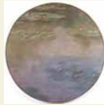
クロード・モネ《睡蓮》1907年 油彩/カンヴァス サン＝ティエヌ近代美術館 Musée d'Art Moderne de Saint-Etienne Métropole