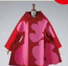
COMME des GARÇONS / 川久保玲 2012年秋冬

世界に評価される日本のファッションの独自性を、服や写真、映像などさまざまな表現で通観。京都服飾文化研究財団(KCI)の収蔵品を中心に展示し、「着る」文化の伝統を守り、革新する京都と現代ファッションの関わりを浮き彫りにする。