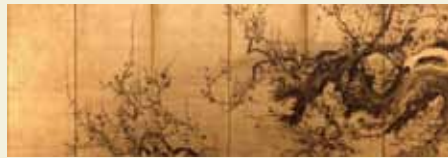
梅岡屏風 彭城百川(さかさきひやくせん) 江戸時代

寒さに耐え、百花にさきがけて香り高く咲く梅は、古来より高潔を保つ文人の理想であり、吉祥や美人の象徴とされてきた。絵画や工芸における梅モチーフの作品を集め、人々の想いが託されたさまざまな梅の姿を紹介する。