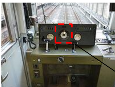
(地下鉄烏丸線運転台)