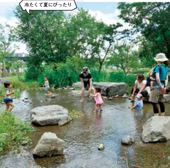
「河原遊び場」は水深が浅いので子ども連れでも安心