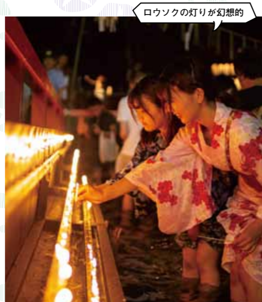
ろうソクの灯りが幻想的