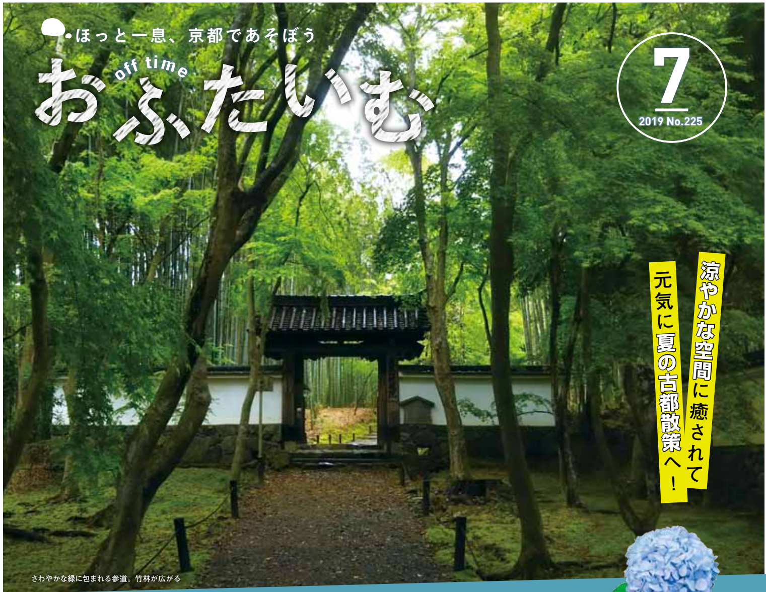
さわやかな緑に包まれる参道。竹林が広がる