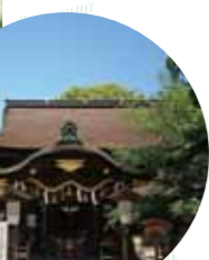
中御門天皇より賜ったという荘厳な本殿