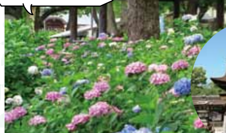
ピンクや青、紫、白など色とりどり