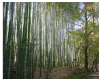
「衣笠山 地蔵院(竹の寺)」参道の竹林

地蔵院をはじめ、嵐山の竹林の道や祇王寺など、京都には竹を愛でるスポットがたくさんあります。京都の竹の歴史は古く、平安時代にはすでに竹が中国から伝来し、育てられたといわれています。強度があり弾力性にもすぐれ、乾湿にも歪みがこない特徴を持つ竹は、京都においても箱や楽器の原材料、建材などとして随所に利用さ