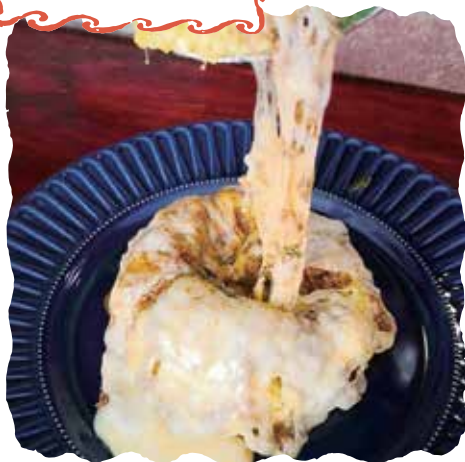
とろとろチーズがかかった合い挽きのキーマ1100円

本格的なスパイスカレー！ 女性1人でも入りやすい 雰囲気です (59歳女性・Kさん)