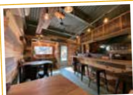
木を基調とした落ち着いた店内