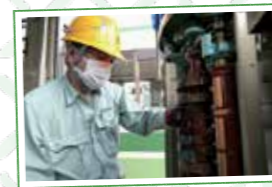
車のアクセルにある主幹制御器の整備中