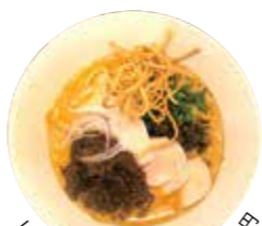
レッドカレースープダブル880円

☎075-823-6118 ⑨11時30分～14時30分、17時30分～21時30分 ⑩水曜 ● 西ノ京円町 (JR円町駅) から 市バス 203・26・91 四条中新道または 壬生寺道下車、徒歩約5分