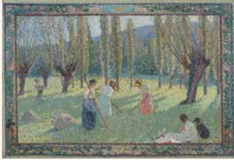
アンリ・マルタン《二番草》1910年、フランス、個人蔵