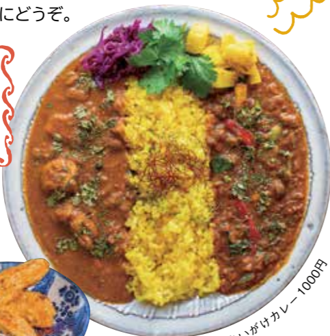
チキンと野菜のあいかけカレー1000円