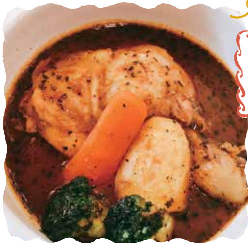
一番人気はチキンスープカレー1100円

☎090-8387-9845 ⑨12時～15時(14時30分LO)、17時～22時(21時LO) ⑩火・水曜