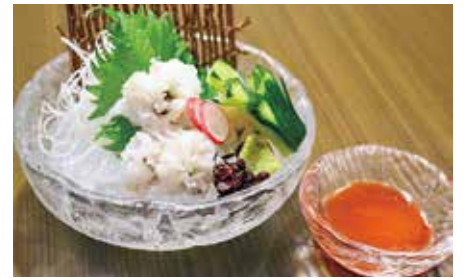
栄養満点で夏バテ防止の効果も期待できる

京都の夏の味覚といえば、ハモが有名。ハモがよく食べられるようになったのは、桃山時代頃だと考えられています。ハモは梅雨の雨を飲んでおいしくなるといわれ、脂がのった7月がシーズン。祇園祭の頃にハモ料理でもてなしたことから、祇園祭を「鱧祭り」と呼ぶこともあるのだそうです。海のない京都市では、かつて海で獲れた活魚を食べるのは難しいことでした。しかし、ハモは生命