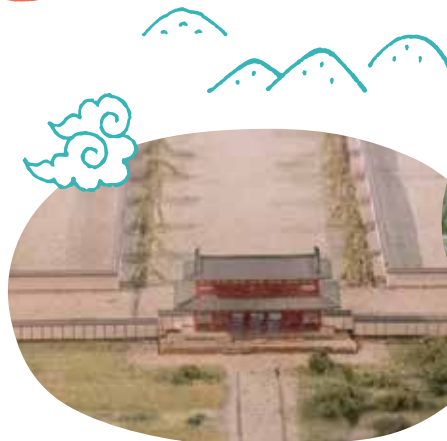
「平安京復元模型」のうち 羅城門(左)と神泉苑(右)

京都にある大小さまざまな「通り」。普段あまり意識していない通りでも、歴史を紐解けば、今とは違う意外な一面が見えてくることも。今回は千本通に注目です。