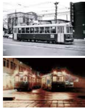
上/撮影日 昭和41年3月 下/撮影日 昭和53年9月