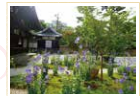
●「源氏庭」。『源氏物語』に登場する朝顔の花は現在の桔梗のことをいう

075-231-0355 9時～16時 園源氏庭500円 地下丸太町駅から徒歩約20分、または 四条烏丸 地下四条駅 から 市バス3 府立医大病院前下車、徒歩約5分