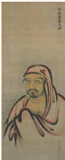
列祖像三十幅のうち初祖 達磨 狩野探幽筆 相国寺蔵

鎌倉時代に日本へやってきた無学祖元から日本僧・高峰顕日、そして夢窓疎石に嗣がれた教え＝法。法が嗣がれた象徴として弟子に渡される師の絵姿を「頂相」という。本展では、そのような法脈を今に伝える頂相を数多く初公開する。