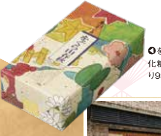
●をぐら山春秋化粧箱（8ヶ入り9袋）1,080円