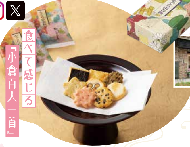
●味の異なる8種のあられが楽しめる

075-762-0345 10時～18時 団年末年始など臨時休業あり 地下 東山駅から徒歩約6分