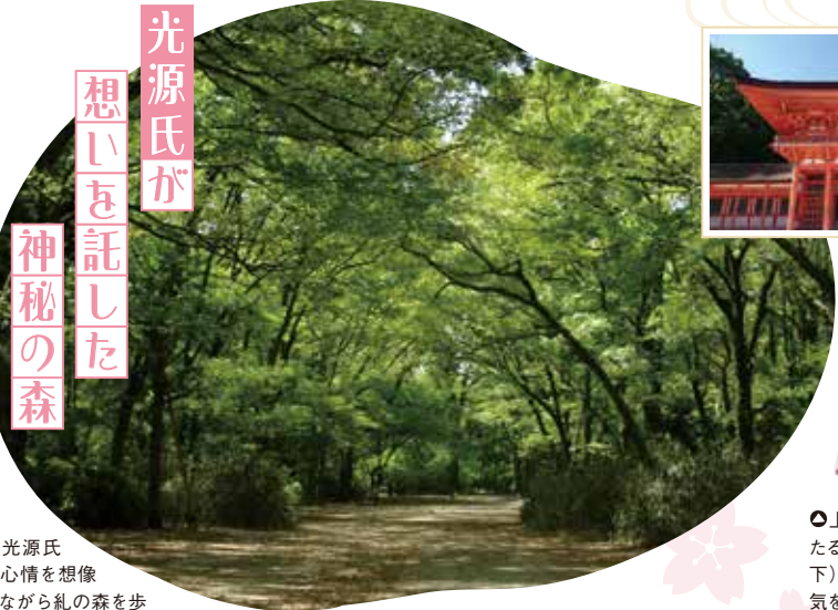
●光源氏の心情を想像しながら緑の森を歩いてみよう

平安遷都1100年を記念し、明治時代に市民の総社として創建。平安京大内裏の正庁「朝堂院」を約8分の5の規模で再現しており、朱塗りの建物と緑釉瓦の屋根が美しく響き合います。平安京で育まれた造園技術を結集したといわれる神苑は、季節の花が咲く風情あるスポットです。