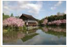
●およそ1万坪の敷地面積を誇る神苑