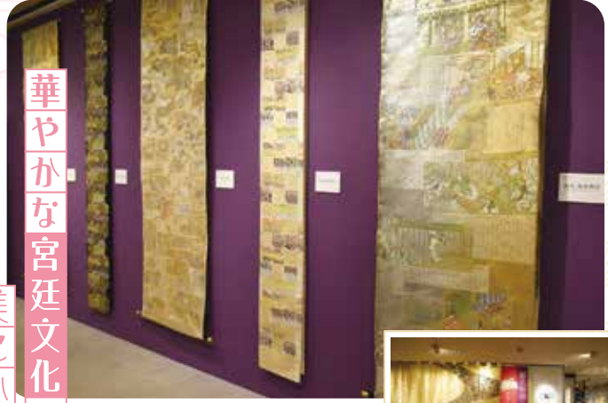
●きらびやかな西陣織は華やかな宮廷文化を想像させる ●展示の様子

075-353-5746 10時～17時（最終入館16時30分） 月曜（祝日は翌日） 500円 地下 四条駅下車すぐ