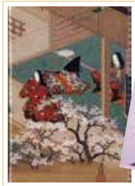
●『源氏物語』がモチーフになった御朱印帳も販売中