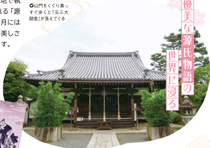
●山門をくぐり真っすぐ歩くと「元三大師堂」が見えてくる

平安時代以前の創始といわれる京都最古の社の一つ。社殿へ続く表参道の両側に広がる緑の森は、『源氏物語』《須磨の巻》で光源氏が都を離れる前の心情を詠んだ場所とされます。縁結びの神様を祀る末社・相生社では、十二単がモチーフのおみくじもあります。