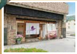
●平安王朝を表現した雅やかな店内となっている