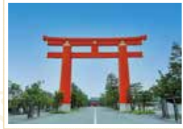
●岡崎のランドマーク「大鳥居」(国登録文化財)

075-761-0221 6時～18時、神苑は8時30分～18時（最終入苑17時30分）※3月15日～9月30日以外の参拝時間はHPを要確認 園神苑600円 地下 東山駅から徒歩約10分