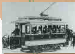
明治28(1895)年、市内線開業日前日試運転の様子