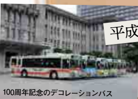
100周年記念のデコレーションバス