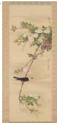
長沢芦雪「薔薇小禽図」