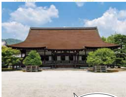
存在感を放つ宸殿

嵯峨天皇の離宮を寺に改めたという皇室ゆかりの門跡寺院。「観月の夕べ」は、中秋の名月、嵯峨天皇が大沢池に舟を浮かべ、文化人や貴族たちと宴を催したことからはじまるといわれています。17時～は龍頭鷓首舟に乗って池を周遊できます。夜空に輝く月と静かな水面に映る月、2つの月を眺める心穏やかな秋宵を味わいましょう。