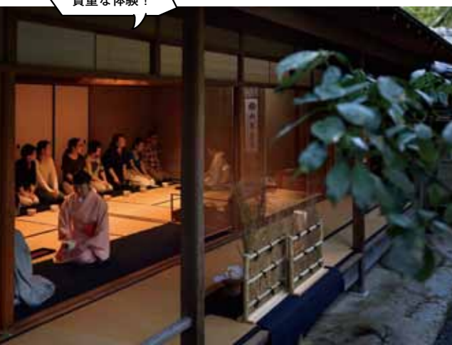
茶室「湖月庵」での茶会はいかに京都らしい