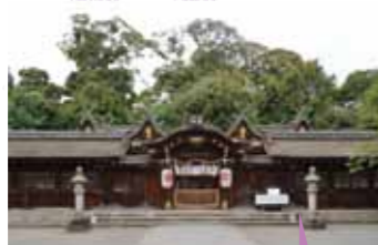
平野通りと呼ばれる二殿一体の本殿

神事終了後、生田流正当派間宮社中による琴の演奏にはじまり、嵐の会の尺八演奏、音輪会の雅楽演奏など伝統芸能が拝殿で奉納されます。19時~は抹茶席のご用意も。月灯りに包まれながら、趣深い特別な一夜を過ごせます。