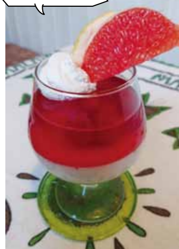
「ラズベリーのパンナコッタ(夏限定)」480円