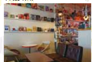
かわいい雑貨が目移りする

☎050-1077-9302 11時~21時30分(20時30分LO) 国日曜 京都駅前から 国150・205 衣笠駅前下車、徒歩約7分