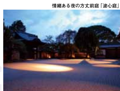
情緒ある夜の方丈前庭「波心庭」