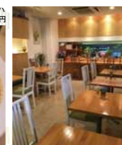
所どころに草花や雑貨が飾られている

本誌をご提示いただいた方に、上記店舗にて【特典】をご提供いたします! 記載のない店舗では特典提供はありません。 期間: 令和元年8月9日(金)~9月30日(月) ※他券・他サービスとの併用不可