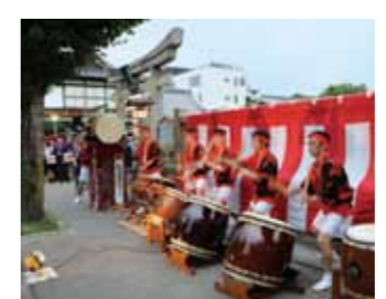
よからう太鼓による演奏奉納が神輿を迎える

めるために神泉苑で御霊会を行いました。平安京だけでなく、貞観地震や富士山の噴火など全国的な災害が続く中、869年には日本の国数である66本の鉾を建立、神泉苑にて祈願したといわれています。この御霊会が現在の祇園祭へとなっています。今でも祇園祭・還幸祭では、御旅所を出発した神輿が途中で神泉苑のお祓いを受け、八坂神社へと戻っていきます。