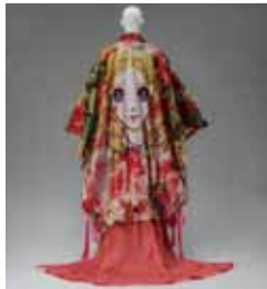
COMME des GARÇONS (川久保玲) 2018 年春夏 京都服飾文化研究財団所蔵