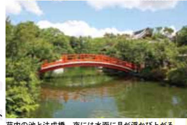
苑内の池と法成橋。夜には水面に月が浮かび上がる