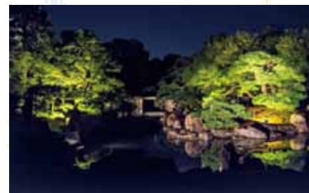
昼とはまた違った表情を見せる二之丸庭園

きらびやかな光景に魅せられる 特別名勝・二之丸庭園がライトアップされ、幽玄の世界が光により幻想的に演出されます。昨年も好評を博したプロジェクションマッピングは今年も実施。子どもたちの「願い」が込められた短冊がゆれる笹飾りのライトアップも。興味深いイベントが目白押しです。