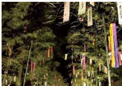
堀川エリアの「願い七夕」

堀川エリア：二条城、堀川遊歩道（下立売通～一条戻橋）周辺／鴨川エリア：鴨川河川敷（仏光寺通～御池通）周辺／梅小路公園エリア（梅小路公園）／北野紙屋川エリア（北野天満宮界隈）／宮津市エリア（天橋立及び周辺市街地） ※イベント詳細についてはホームページに順次UPされます。 ☎075-222-0389（京の七夕実行委員会事務局）