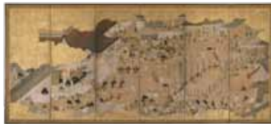
御即位図屏風 相国寺蔵

☎075-241-0423 ☎10時～17時(入館は16時30分まで) 🎫800円 国会期中無休