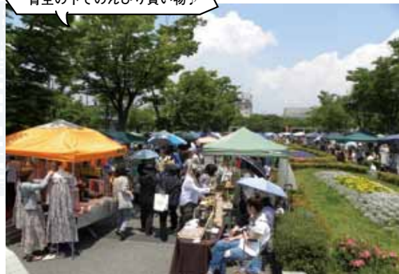
広々とした公園に ずらりと出店がある