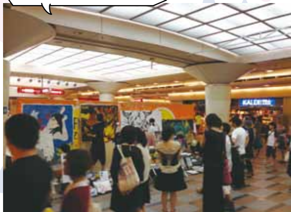
アート作品に 特化した出店