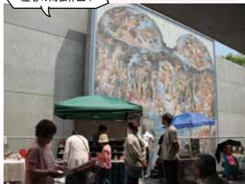
クラフト作品はどれも個性がキラリと光る