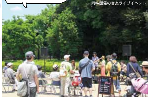
同時開催の音楽ライブイベント

☎090-1247-1429 ⑨9時～16時(雨天決行) ※大雨や暴風等の特別警報発令時は中止の場合あり 🆓無料(植物園内エリアは入場料200円が必要)