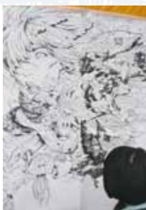
ライブペイントなど 珍しいイベントも

☎080-3030-4779 ⑩10時～18時 🚶🚶🚶 地下 京都市役所前下車すぐ、または 徒歩5分 京都駅前下車、徒歩約2分