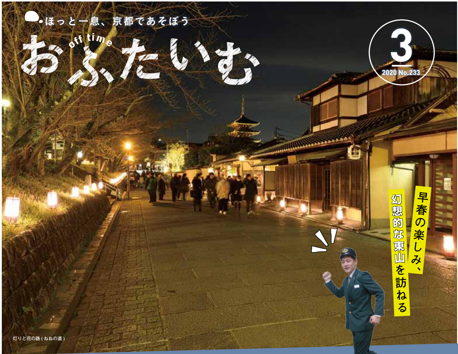
灯りと花の路(ねねの道)