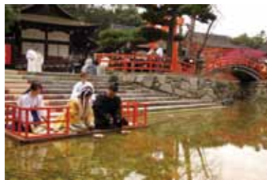
3月3日に行われる、下鴨神社の「流し雛」

「桃の節句」といわれる3月3日は雛まつり。京都における雛まつりの起源は、平安時代にさかのぼります。平安京における貴族の子女の人形遊びがその始まりだと考えられているそうです。現在の雛飾りの配置は、地域差はあるものの平安時代の宮中を表わしていることから、その名残が感じられます。江戸時代には庶民へと伝わり、次第に3月3日には女の子のお祝いの儀式として