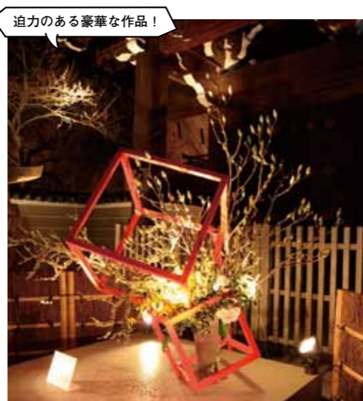
いけばなプロムナード(後期)

02 いけばなプロムナード 闇に浮かぶ絢爛たる華 京都いけばな協会の協力により「灯りと花の路」沿いに、大型花器を用いたいけばな作品を展示。前期・後期で入れ替わるので要注目です。