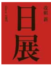
巨匠から新人まで幅広い作家の作品が集う

☎075-771-4107 ⑨9時～17時(入場は16時30分まで) 図1,000円 毎月曜(12/24は開館)、12/28～1/2