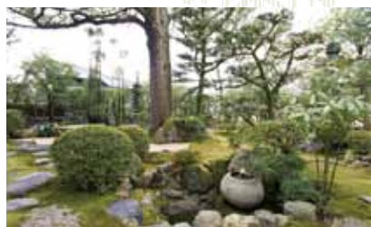
当日は本堂奥の庭園に席が設けられる

☎075-463-0714 ◎9時~16時 ◎境内自由 ◎無休 📍丸太町駅から徒歩10分 📍鳴滝本町下車、徒歩約3分