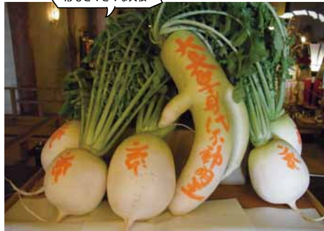
大根には魔除けの梵字が書かれる