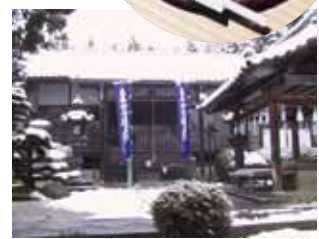
雪景色に染まる本堂も風情があふれる

☎075-462-6540 ◎9時~16時 ◎境内自由 ◎無休 📍太秦天神川駅から徒歩8分 📍三寶寺下車、徒歩約5分