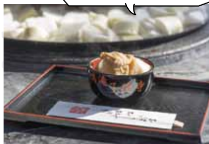
大根は前日の早朝に振り出された新鮮なものを使う