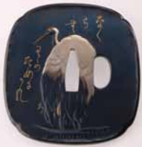
難波湯図鐔 正阿弥勝義

☎075-532-4270 ⑨10時～17時(入館は16時30分まで) 図800円 毎月・火曜(12/24・1/14・2/11は開館)、12/25～1/2