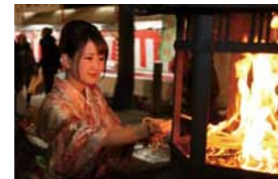
新たな一年の安泰を祈る

毎年大晦日の夜から元日の早朝にかけて八坂神社で行われる「をけら詣り」は、無病息災・厄除けを祈る行事。古式にのっとり切り出された御神火が境内に吊された灯籠に灯され、人びとの願いを記した「をけら木」とともに夜通し焚かれます。をけらは焚くときつい臭いがするためその臭いで邪気をはらうという意味があり、胃に効く薬草に