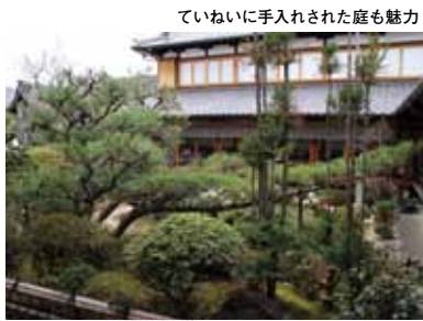
ていねいに手入れされた庭も魅力