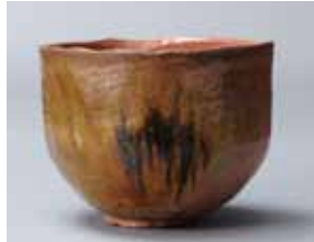
光悦作 青火替り赤筒茶碗 銘「有明」

☎075-707-1800 ◎9時30分～17時30分(入館は17時10分まで) 📍500円 🕒期間中無休