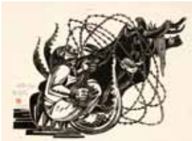
「沖縄のさげび 蛇皮線」 1960年頃

沖縄戦やアメリカ軍基地問題などをテーマに、出身地の沖縄を描く版画家・儀間比呂志。住民視点を重視し力強い線で描かれた作品は、人々の心に強く訴えかける。本展では奥田豊氏の旧蔵コレクション68点を展示する。