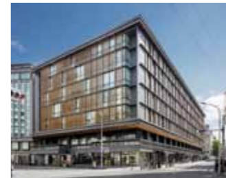
スタイリッシュな建物が目を惹く京都経済センター

京都の繊維産業、ファッション界の発展を常にリードしてきた四条室町一帯。「京都産業会館」は、そんな四条室町に1965年11月、繊維業界と京都市が協力して設立されました。長年にわたり、多くの商社が着物などの繊維製品の展示会や商談会、就職セミナーなどの会場として利用してきましたが、解体工事のため2016年3月末に惜しまれつつ閉館。その跡