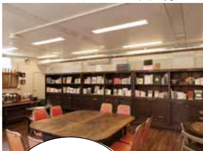
本棚やいすも小学校時代に使われていたもの

☎075-585-5561 ①11時～20時(屋外での図書館ボックス利用は晴れの日の17時まで) ②不定休 ③四条烏丸(地下四条駅)から徒歩約5分