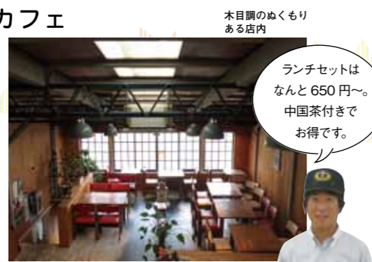
木目調のぬくもりある店内

☎075-211-4757 ①12時～23時(22時30分LO) ②木曜 ③四条烏丸(地下四条駅)から徒歩約12分または④丸太町下車、徒歩約3分