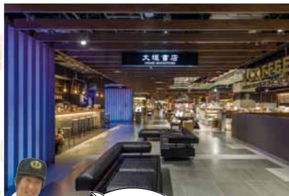
書斎をイメージしたソファが配置されたシックな空間

☎075-708-3930 ①10時～22時(カフェは21時30分LO) ②1/1・2 ③四条烏丸(地下四条駅)から徒歩約4分