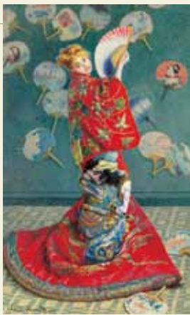
クロード・モネ 《ラ・ジャポネーズ》(着物をまとつカミーユ・モネ) 1876年 1951 Purchase Fund 56.147