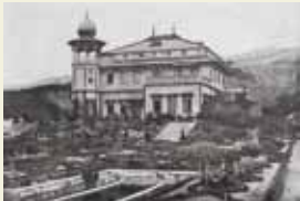
二楽荘本館と庭園

西本願寺第22世宗主、大谷光瑞師によって六甲山麓に建てられた二楽荘は、インドのタージ・マハル廟を模し、本邦無二の珍建物と称された。気象観測や大谷探検隊の調査研究なども行われた二楽荘の歴史的意義を探る。