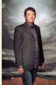
ピアニスト/ペレヅフスキー

☎075-711-3231 (電話受付は10時~17時) ☎14時~ 🎫S席20,000円/A席16,000円/B席13,000円/C席11,000円/D席 売切 🗓第1・3月曜(祝日の場合は開館、翌日休館)、年末年始 📍京都市駅前から市バス10-10 京都コンサートホール前下車、徒歩約5分