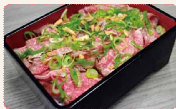
じっくり仕上げたローストビーフがぎゅっしり！女性に人気の京都牛肉重 1,000円

☎075-326-0298 ⑩11時45分～14時30分(14時LO、平日のみ)、17時～翌2時(日曜～翌1時) ④無休 ②京都駅前から徒歩7分 ③西大路五条下車すぐ、または西京極総合運動公園から徒歩32分 ④西大路五条下車すぐ