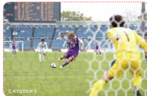
勝敗を決めるシュートの瞬間に、会場全体が息をのむ