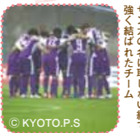
サンガの名に恥じない絆で、強く結ばれたチーム

サンスクリット語で「仲間」を表す言葉と、京都を想起させる「山河」の響きを掛けあわせて命名されたプロサッカークラブの京都サンガ F.C.。その名の通り強い絆が生み出す巧みなチームプレイで J1 昇格を目指して日々奮闘する京都サンガ F.C. に、あなたの熱い声援を送ろう！