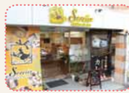
イトインスペースでのカフェ利用も可能

ケーキ、パン、アイスなどが数多く並ぶ人気のスイーツ店。それだけでなく店内ランチメニューにはソルシエカレーなるものが。スポーツ観戦の後に立ちよれば、パティシエならではのこだわりが詰まったカレーやスイーツに、お腹も心も満たされること間違いなし。