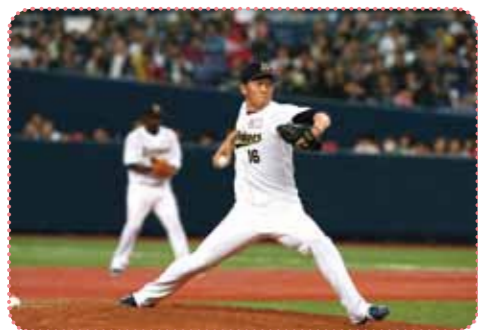
力強い投球を見せる平野投手

わかさスタジアム京都でプロ野球の公式試合が開催されるのは、なんと5年ぶり。プロ野球ファンにはたまらない一戦を、この機会にお見逃しなく！