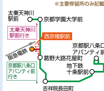
※主要停留所のみ記載

葛野大路通を南北に運行する84号系統を、阪急西京極駅前広場へ乗り入れる経路に変更しました。