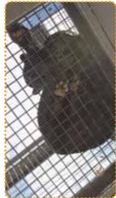
ミワを間近で見られるオーバーハング