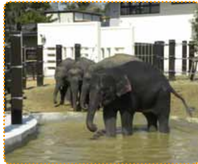
体は大きくても表情には子供らしさが残る

ラオス人民民主共和国から京都市動物園へ、4頭の子ゾウが寄贈され、今年2月にお披露目された。子ゾウの到着に合わせて整備された「ゾウの森」エリアでは、まだまだあどけなさが残る子ゾウたちと、園の人気者であるゾウの美都がグラウンドやプールで楽しそうに遊ぶ姿を見ることができ、子ゾウそれぞれに個性があり、それを観察するのも面白い。