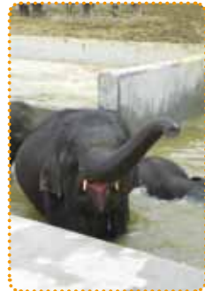
水遊びが大好きな子ゾウたち