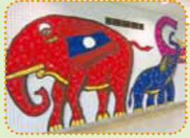
「家族」をイメージしたカラフルなゾウのアニマルアート