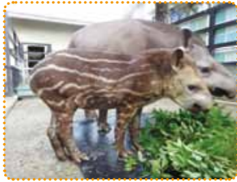
いつでもお母さんと一緒

去年の9月に誕生し、今年2月に待望の公開デビューを果たしたブラジルバクの赤ちゃん。つぶらな瞳と、お母さんに甘える姿が愛らしい。独特のしま模様が見られるのは生後約1年間のみなので、この機会にぜひ会いに行ってみよう。