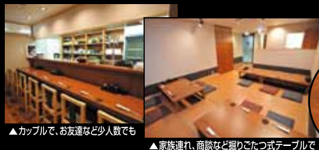
▲カッパルで、お友達など少人数でも