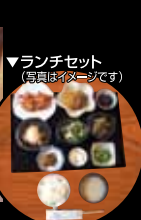
▼ランチセット(写真はイメージです)

ランチタイム AM11:00~PM3:00 ままぐれおばんざいランチセット(コーヒー又は、ゆずティー付).....1,000円