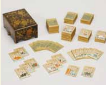
百人一首かるた(江戸時代)