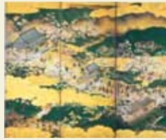
重要文化財 吉野花見図屏風(左隻・部分) 京都・細見美術館 展示期間:前期(4/7~5/17)