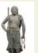
重要文化財 木造 不動明王立像(本尊) 平安時代後期 聖護院蔵

皇族が住職を勤めた門跡寺院で、現在は本山修験宗の総本山である聖護院。平安末期に聖護院を創建した増善大僧正の900年遠忌法要を記念し、聖護院と本山修験宗をテーマにした初めての展覧会が開催される。本尊の不動明王立像(重文)をはじめ、貴重な宝物と絢爛豪華な障壁画などが展示される。