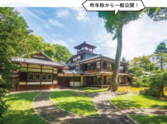
昨年秋から一般公開!