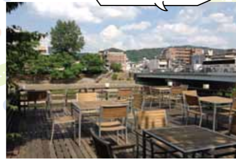
夏は川床で優雅なティータイム

☎075-211-4121 ☎11時~20時(19時30分LO、5~9月は~21時、20時30分LO) 休なし 地下 京都市役所前駅下車、徒歩約3分、または 市バス4-5・17・104・205 京都市役所前下車、徒歩約2分