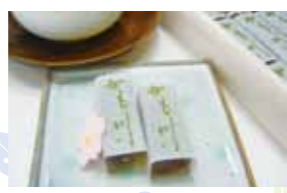
長生堂を代表する銘菓「かもがわ」

地元人のご用達 老舗菓子舗・長久堂にのれん分けを許され、大正8年(1919)に創業。一店舗主義で守られる良質な材料と作り手の温もりが宿る、雅な京菓子が人気です。茶房・長寿庵を併設しており、かき氷など季節の品も味わえます。