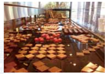
目にも楽しいショコラが並ぶ店内

極上ショコラで至福のひとつき 1935年創業の老舗ショコラティエ。この時期は、なんとといっても川床で紅茶やスイーツなどが楽しめる「カフェ床」が人気です。和と洋が融合した、高級で洗練された商品の数々を開放的な空間で味わいましょう。