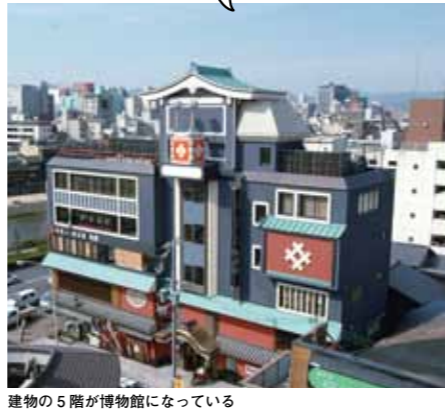
建物の5階が博物館になっている

本誌をご提示いただいた方に、上記店舗にて「特典」をご提供いたします! ※サロンドロワイヤル京都は切り抜きと交換期間:平成29年6月15日(木)~7月13日(木) ※他券・他サービスとの併用不可