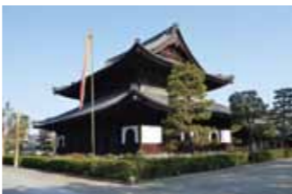
建仁寺境内にも併せて楽しみたい

戦国時代に長篠の合戦で武田軍を退け、その功により家康の娘を妻に迎えた奥平信昌。その菩提寺である久昌院本堂には信昌の活躍を描く襖絵「長篠合戦図」が飾られている。この貴重な機会にぜひ訪れたい。