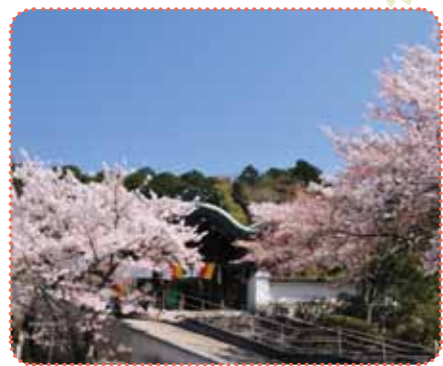
満開のソメイヨシノに迎えられて境内へ

おふたいむ4月号をご提示いただいた方に、「むしやしない」と「伏見夢百衆」にて 特典 をご提供いたします！ 期間：平成28年3/15(火)～4/14(木) ※他券・他サービスとの併用不可