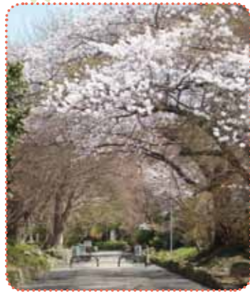
桜のアーチの下をのんびり散策できる西参道