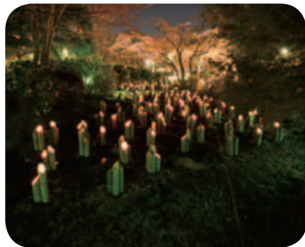
円山公園内の「竹灯り・幽玄の川」

早春の古都を彩る、やさしい灯りときらびやかな花々。 市バスや地下鉄を利用して、情緒あふれる夜の東山へ出かけましょう。