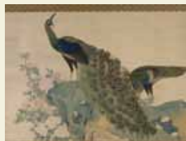
重要文化財 牡丹孔雀図 円山応挙筆 相国寺蔵

花鳥画とは樹木草花や鳥、昆虫、獣類などを主題とする東洋画の一部門。中国明時代に描かれた極彩色の花鳥画をはじめ、日本室町時代の水墨花鳥画、江戸時代の狩野派・土佐派の作品など、各時代の花鳥画を一室に展示する。