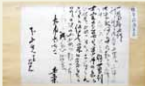
坂本龍馬 書状 本山只一郎蔵

幕末維新の顕彰団体「京都義正社」寄贈の資料を中心に、新しい日本のために奔走した志士たちの足跡をたどる。坂本龍馬の書簡や高杉晋作愛用の銅盆などに加え、斎藤一の新発見資料や近藤勇の鎖帷子など新選組の資料も多数展示。