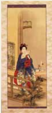
幸野操画「妓女図」 明治6年 京都府立総合資料館蔵 (京都文化博物館管理)

京都の歴史と文化をわかりやすく紹介する京都文化博物館。多彩な特別展に加え、総合展示室でも京都ゆかりの名品を紹介。今回は、幕末明治における京都の日本画を集め、京都府立総合資料館所蔵の作品を中心に展示する。