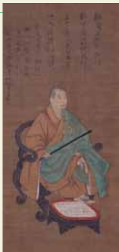
重要文化財 一休純像 自費室町時代 願忠庵 (一休寺蔵)

おすすめアクセス 京都駅前からバス100-206-208 博物館三十三間堂下車すぐ