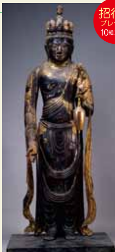
重要文化財 十一面観音立像 平安時代 禪定寺蔵