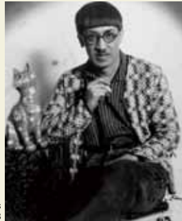
藤田嗣治の写真(1928)

藤田嗣治が画家を志し単身フランスに渡ってからの18年間に焦点を当て、エコール・ド・パリの寵児「フジタ」誕生の軌跡を探る。パスキンやキスリング、ローランサンら、藤田と時代を共にした芸術家たちの作品も展示する。