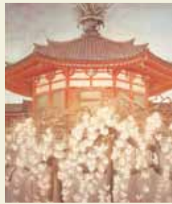
夢殿(昭和47年)第4回日展