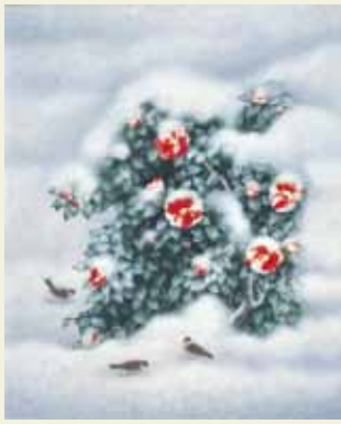
雪つばき(平成6年) 第26回日展 日本芸術院蔵