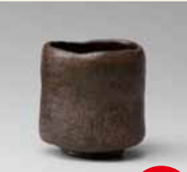
初代長次郎「杓ヲレ」

千利休や今年400年忌となる二代少庵、その息子の三代宗旦らにゆかりの楽茶碗や茶道美術など、千家にまつわる名品が集結。2年の歳月をかけて修復された長谷川等伯筆「松林架橋図襖」4面も特別展示される(修復後初公開)。