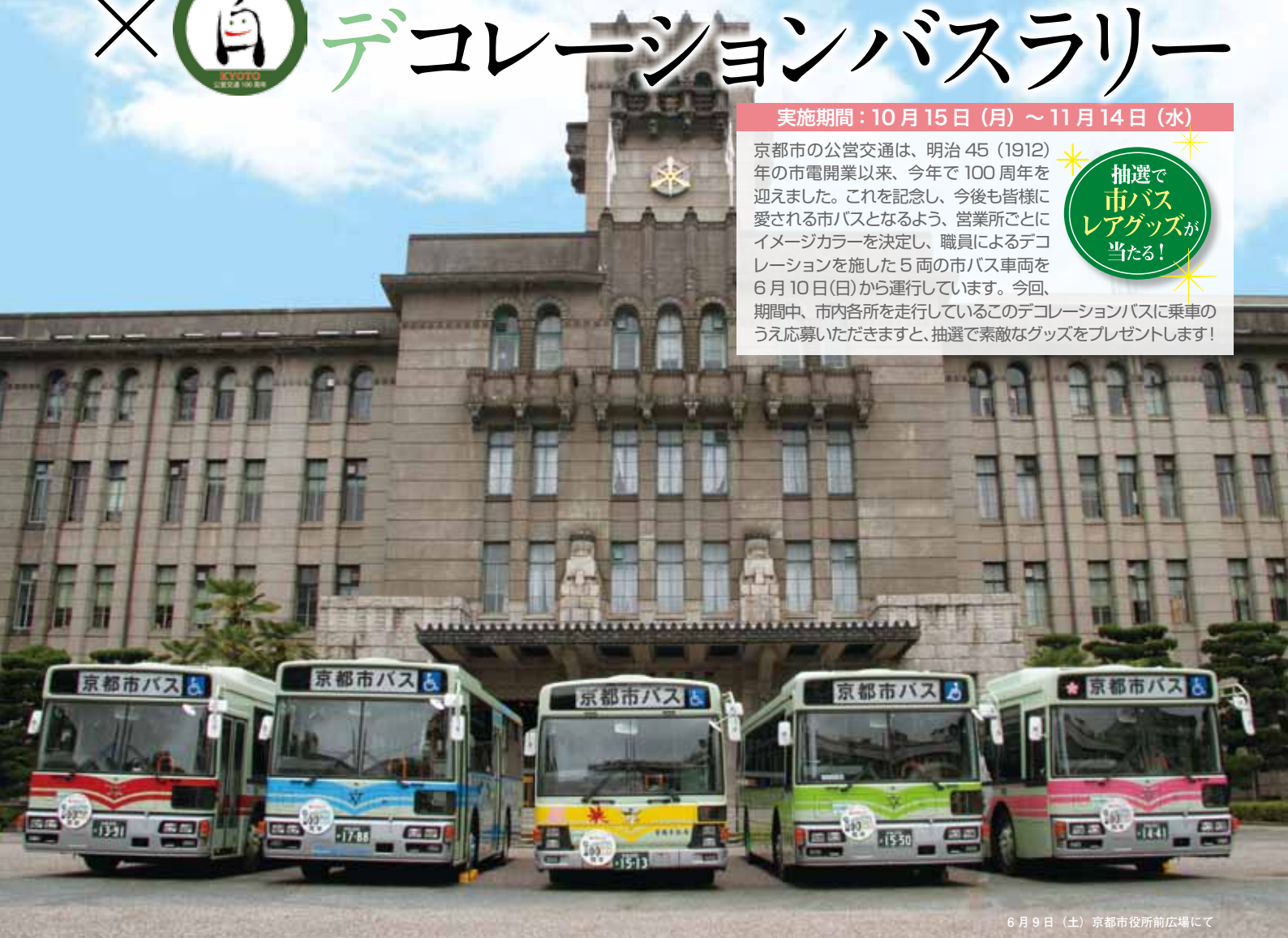
6月9日（土）京都市役所前広場にて