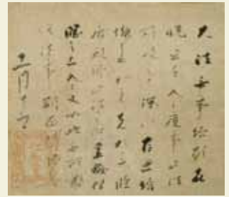
国宝 高倉天皇宸翰消息 平安時代 治承二年(1178) 京都・仁和寺藏