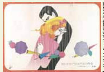
上村一夫(シエラフィルの雨傘) 1973年 東京国立近代美術館フィルムセンター蔵

1960年代を中心に約80点の映画ポスターが集結。映画黄金期に結びついたさまざまなグラフィズムと映画の結節点を探り、スクリーンの外側に花開いた、映画芸術のもうひとつの“顔”を紹介する。