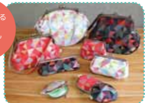
岡崎本店限定「帯地 風車柄シリーズ」

☎075-751-0545 ⑩10時~18時 ㊦不定休 ㊤四條鳥丸 (地下鉄四條駅) から㊤46 ㊤岡崎公園 美術館・平安神宮前下車、徒歩約6分、または㊤京都駅前から㊤5・100 ㊤岡崎公園 動物園前下車、徒歩約3分