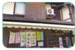
町家風情の残る趣ある工場