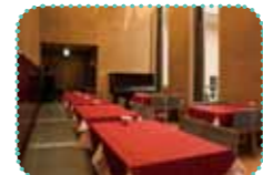
美術館鑑賞の余韻を楽しむアートな空間