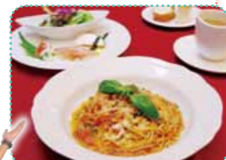
コクが深いバジルとトマトのバスタランチコース (トマトソース) 1,500円