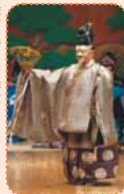
厳かに彩られる舞台

ロームシアター京都のオープニングに華を添える、多彩なジャンルの公演の数々。その中から、選りすぐりの2公演をご紹介します！ ※詳細はWEBサイトをご覧ください