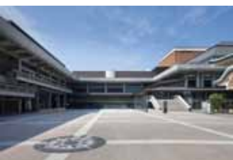
開放的な空間が広がる

隣接する岡崎公園と一体になった憩いのスペース。野外イベントなども行われ、岡崎エリアはさらに賑やかに。二条通から冷泉通までを行き来できる、総合案内も備えたプロムナードを通れば、岡崎散策が一層おもしろくなること間違いなし。