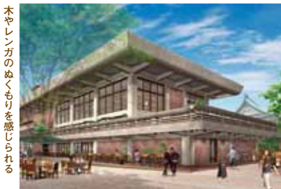
木やレンガのぬくもりを感じられる

本を読みながらスターバックスのコーヒーが飲める蔦屋書店(1階)や、ゆったり落ち着いた雰囲気のレストラン(2階)が新たにオープン。観劇以外にも気軽に利用できるのがうれしい。