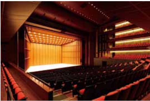
舞台の広さ・高さは第一ホールの約2倍に拡張