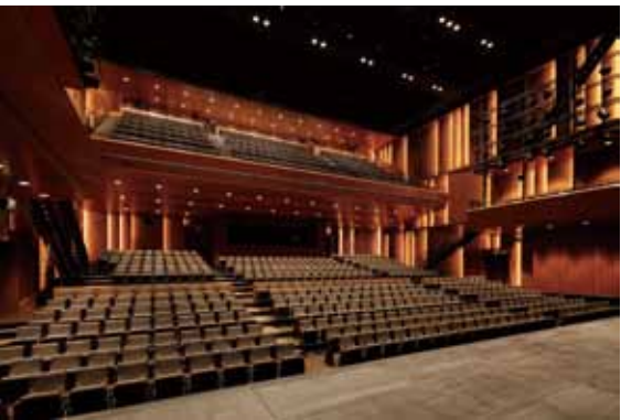
客席側はシックなデザイン