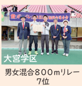
男女混合800mリレー7位