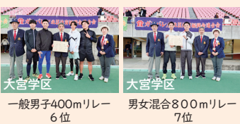
一般男子400mリレー6位